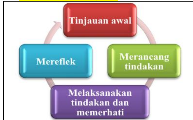
Rajah 1: Model kajian tindakan Lewin oleh Laidlaw (1992)